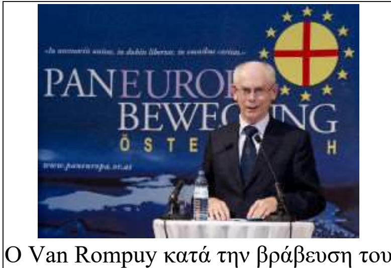
Ο Van Rompuy κατά την βράβευση του

Στις 16 Νοεμβρίου 2012, απονεμήθηκε στον Πρόεδρο του Ευρωπαϊκού Συμβουλίου κ. Herman Van Rompuy το ευρωπαϊκό βραβείο Coudenhove-Kalergi 2012, σε ειδικό συνέδριο στη Βιέννη, για τον εορτασμό των 90 χρόνων του πανευρωπαϊκού κινήματος. Το βραβείο απονέμεται ανά διετία σε ηγετικές προσωπικότητες, για την εξαιρετική συμβολή τους στη διαδικασία της ευρωπαϊκής ενοποίησης.